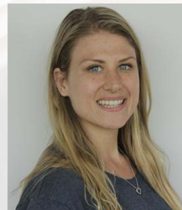
Eva Medewerker klantcontact

Bent u 60 jaar of ouder en werknemer? Dan kunt u vanaf 3 januari 2022 misschien gebruikmaken van een van de Zwaarwerkregelingen die zijn opgenomen in de nieuwe cao SAGV. Het gaat om de Regeling Generatiepact (80/90/100% regeling) en de Regeling Vervroegd Uittreden (RVU). Deze regelingen worden Zwaarwerkregelingen genoemd, omdat niet iedereen met een zwaar beroep kan doorwerken tot de pensioenleeftijd. Het werk in de schilderssector is zo'n zwaar beroep.